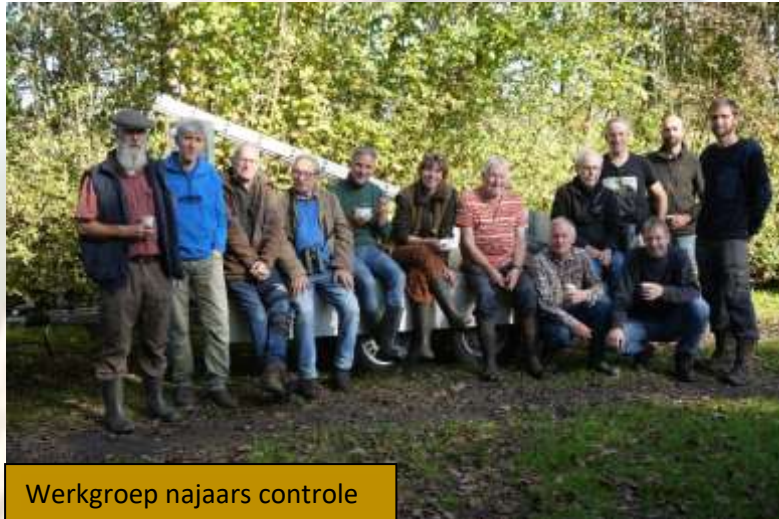
Werkgroep najaars controle