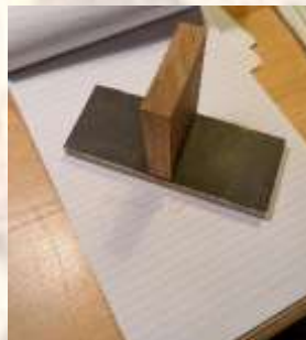
FIGUUR 1 MARTERSLOT

'S middags worden bij Rens Kuijten aan de Vlaamseweg vaste ankerpunten aangebracht waarna de kasten worden schoongemaakt met de valbeveiliging. Hierna volgt nog de schoonmaak van een viertal andere hoge kerkuil kasten met de valbeveiliging. Dit alles zal worden uitgevoerd met de werkgroepleden die een veiligheidskursus gevolgd hebben.